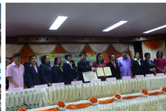
นครราชสีมา