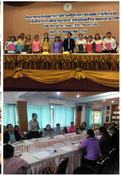
ห้องทนาย