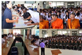
เพชรบูรณ์