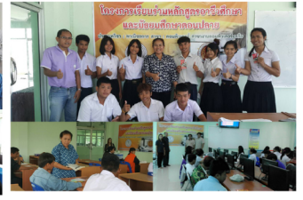
สุรินทร์