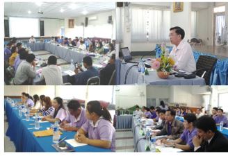
เขียนราย