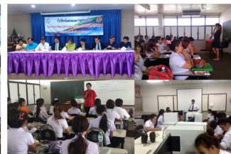
สมุทรปราการ