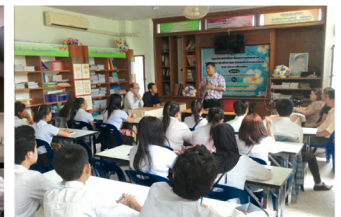
นครศรีธรรมราช