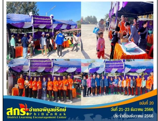
ฉบับที่ 20 วันที่ 21-23 ธันวาคม 2566 ประจำปีเดือนธันวาคม 2566